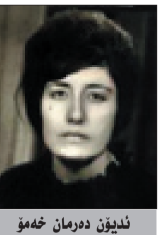
ندیون دهرمان خه مو

زانست بووینه له شاری هه ولیر و عه نکاوا، چه ندین نوه لهسهر دهستیان پیگه یشتون، چرای