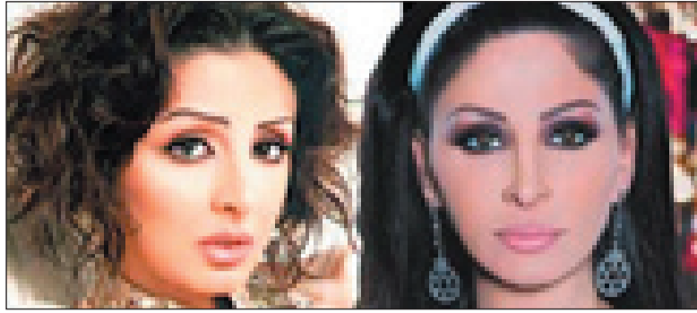
شريف منير والذي تم استبداله بالمثل القيام بالفيلم بالفعل وتم الإعلان عن ذلك مؤخرا في وسائل الإعلام المختلفة.