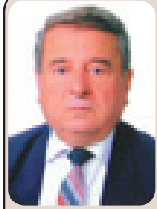
يحكي في مجالس عنكاوا