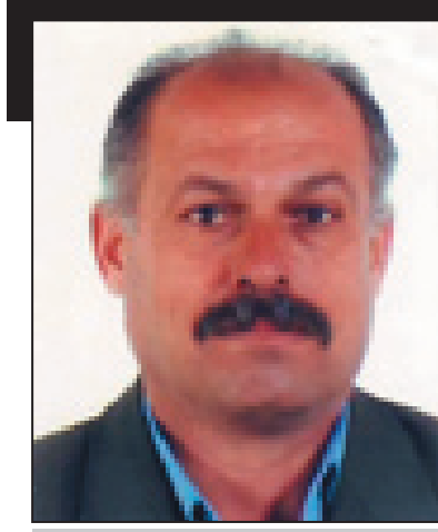
عه دنان ئي ليا

پنده كهن نه وه يه كه وا گنده لي و قورخ كردني داها ت و ساماني كشتي كي لي به رپر سه باوه لامي راست و متمانه پي نيراو بدات لايه ني به رپر س له م وه زعه دا. چونكه نه م نه وت و سامانه مولكي كه سيك و گروپيكي ني يه پيويسته وهك ولاتاني ده ورو به ر جكه له و به شه ي بو پيداويستي هاو لاتيان و گارگه و دامه زراو موليده كان و فه رمانگه كان بوي دا بين بكي. به شه داها ته كه ي تر له حساباتي يه كه كي تاكي نه م ولاته دا دا بنريت جابه چ ميكانيزم و ياسايه ك بيت به دهر له وه ي به شي خزمه ت گوزاري و بوژانه وه ي گشت كه رته كاني تر كه خزمه ت به گه ل و نيشتمان بكات.